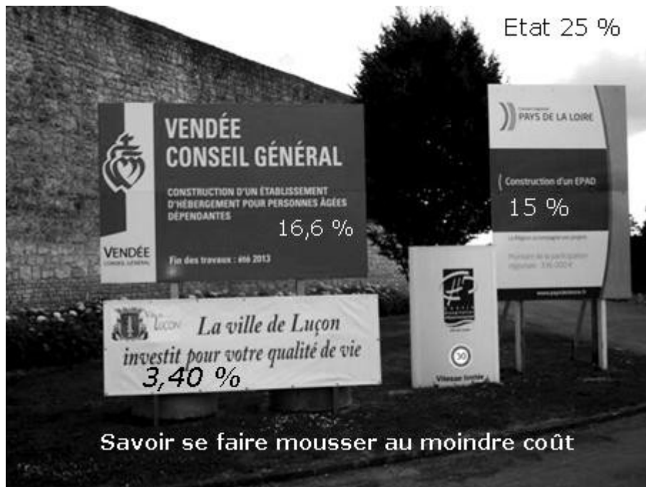
Savoir se faire mousser au moindre coût