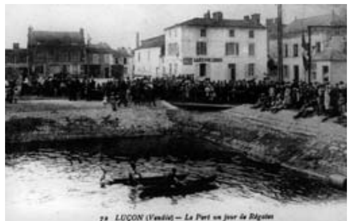
78 LUÇON (Vendée) — Le Port un jour de Régalin

Mais il y a plus compliqué : pour maintenir toute l'année une cote d'équilibre (niveau de la nappe phréatique au dessous duquel il ne faut pas descendre), se trouve posée naturellement la question de la gestion de l'eau dans notre zone géologique particulière, de contact entre le marais et la plaine.